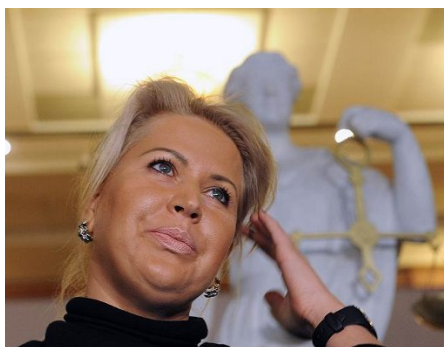
Коза отпущения или мышь, которую породила гора заявлений чиновников о борьбе с коррупцией?

Замысел кремлевских пиарщиков, видимо, состоял в том, чтобы показать, как на самом высоком уровне борются с коррупцией. Но получилось-то наоборот! Показали всему миру, как высокопоставленную коррупцию покрывают.