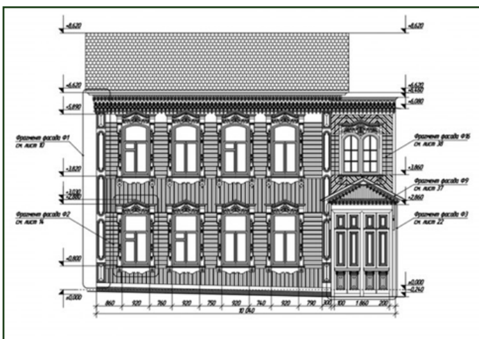
Дом Маториных, проект реставрации.