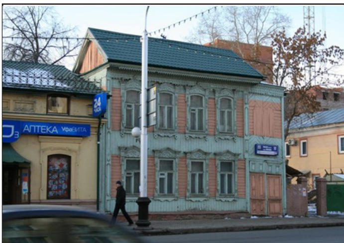
Дом Маториных. Памятник деревянного зодчества.