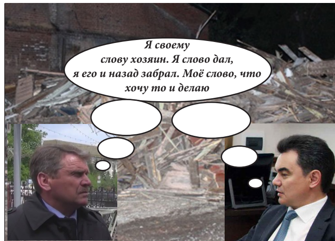
Дом Маториных отреставрированный иванами не помнящими родства. Памятник деревянному зодчеству...

Василий Котов, редакция газеты «Бумеранг»